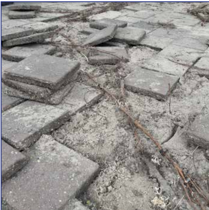
Foto boven: De enorme wortelgroei onder de tegels. Foto onder: Om de wortelgroei te stoppen heeft Buha langs de baan een sleuf gegraven.

de wortel. De vrijwilligers, die wekelijks op de baan actief zijn, hebben geconstateerd dat het asfalt aan de buitenzijde van de baan omhoog kwam door de wortels. Daarom heeft BUHA langs de baan een sleuf gegraven en daarin folie geplaatst van voldoende dikte om verdere groei tegen te gaan. Ook zijn door enkele vrijwilligers de vele wortels onder de tegels op het plein verwijderd. Dat was een hele klus.