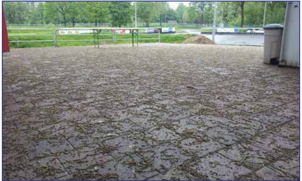
Foto's: Het plein bezaaid met afgevallen takjes (boven) en bergen afgevallen blad (onder)

Gedurende het jaar breken regelmatig takjes af, die naar beneden vallen. En in de herfst vallen ook nog de bladeren. Met andere woorden: abelen mogen dan mooie bomen zijn, je hebt er wel het hele jaar door flinke overlast van.