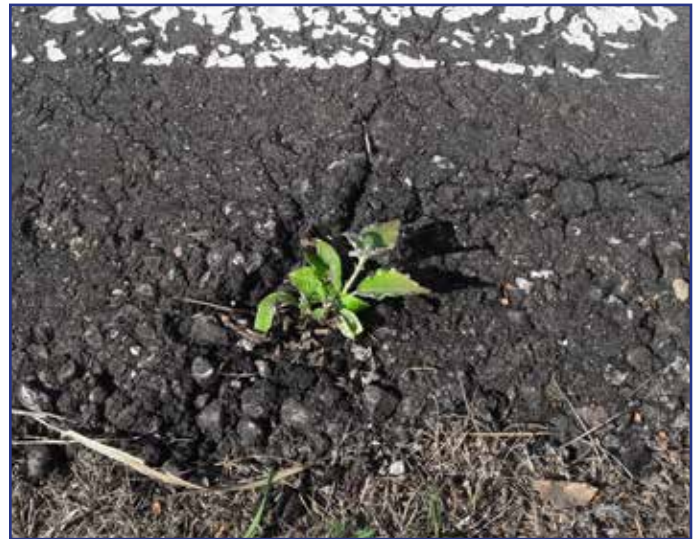
Foto boven: Een jonge abeel heeft zich door het asfalt aan de rand van de baan heen gewerkt. Foto onder: Een kruiwagen vol pluus.