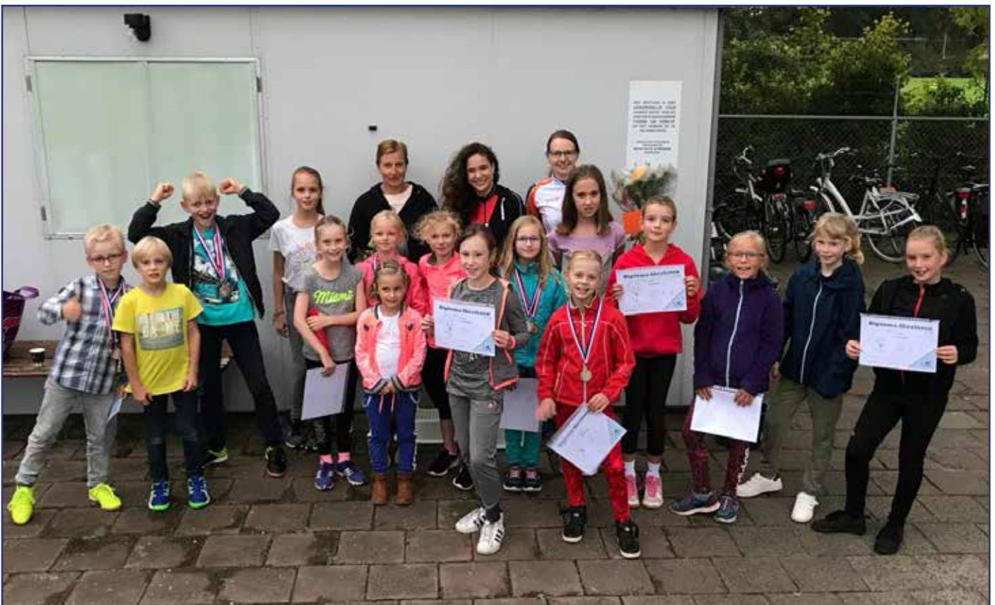
Foto: Trotse gezichten bij de diploma uitreiking